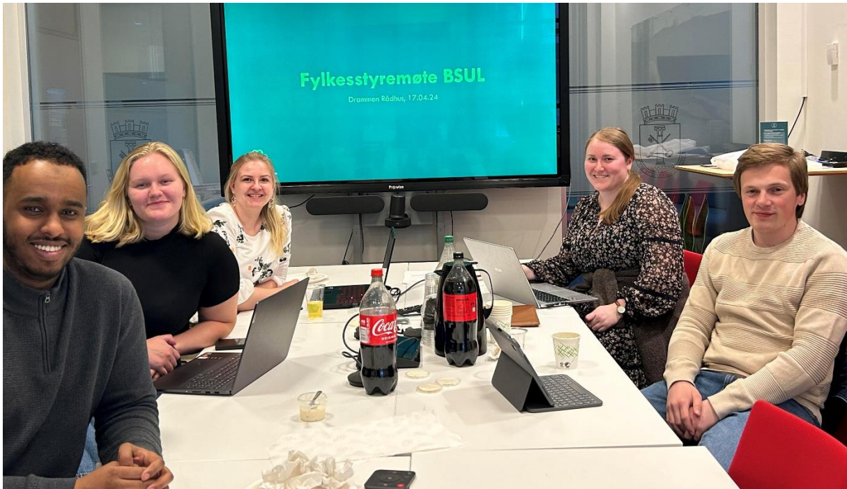
Første fylkesstyremøte i Drammen 17.04.24