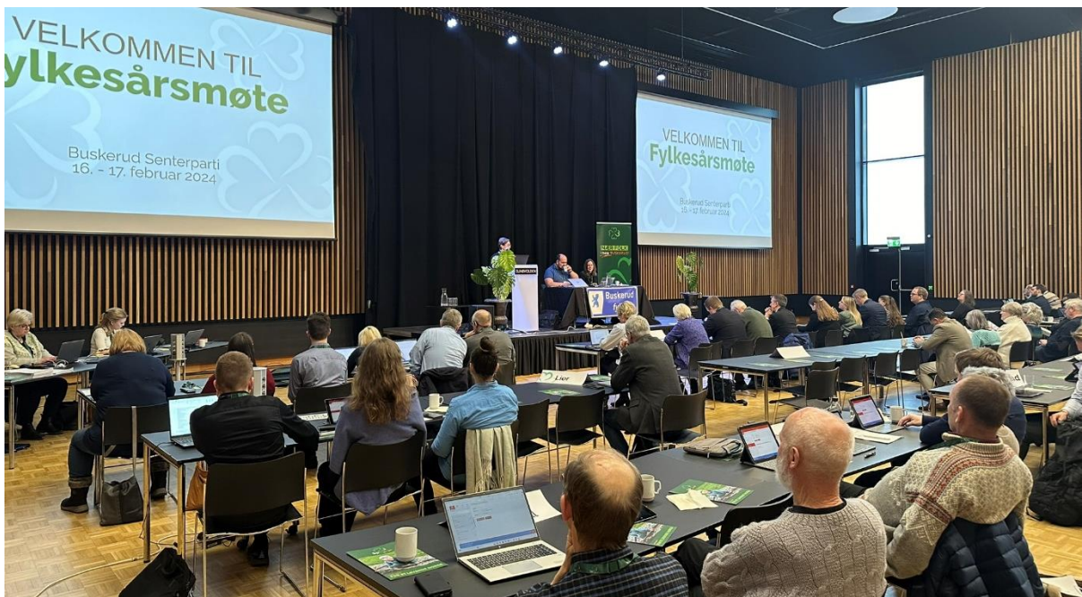
Figur 2 Fylkesårs møte på Sundvolden hotell 2024