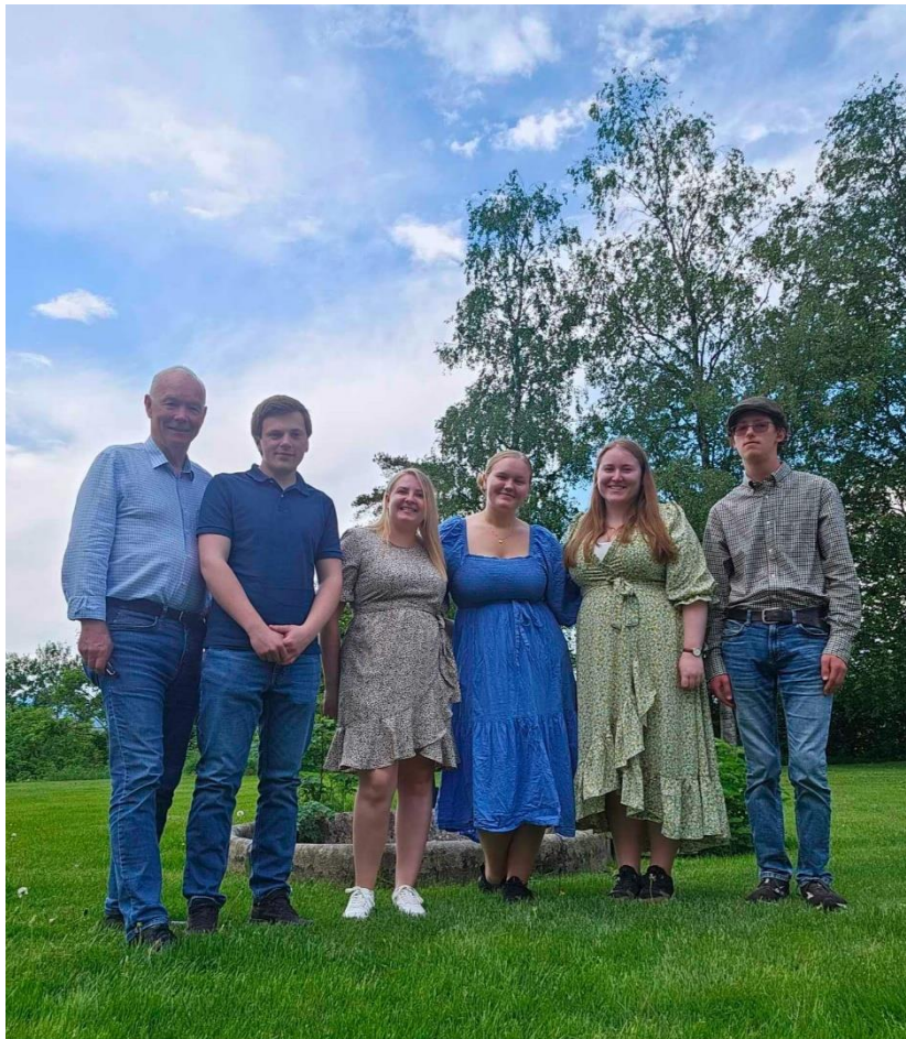
Sommeravslutning på Sokna med Per Olaf Lundteigen