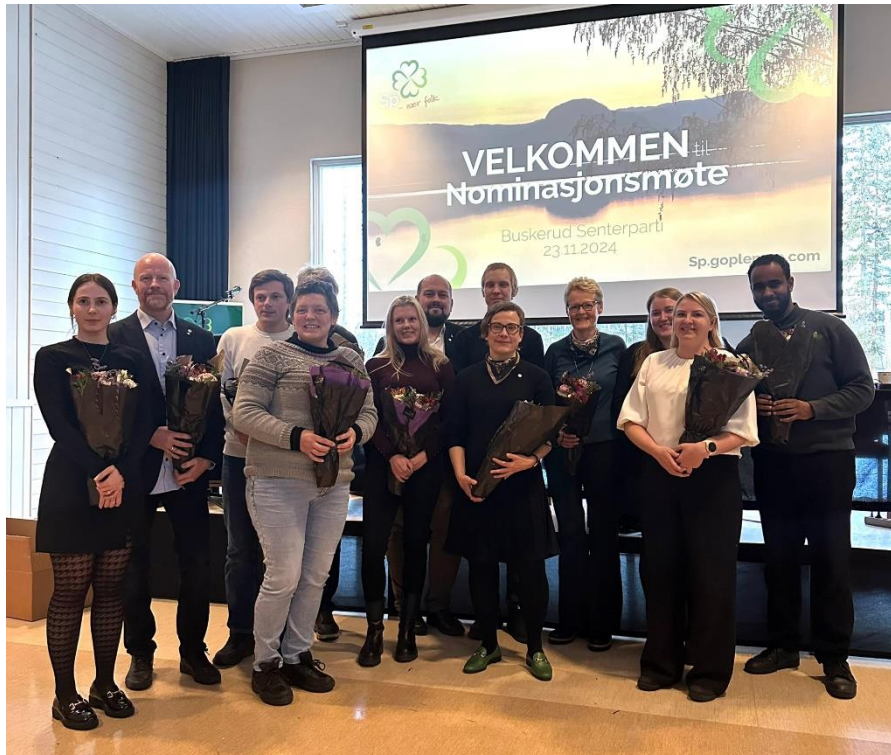
Figur 10 BSp sine kandidater til stortingsvalget 2025

Nominasjonskomiteens innstilling til 1. plass ble valgt, mens nominasjonsmøtet valgt å bytte 2. og 3. kandidat i forhold til innstillinga.