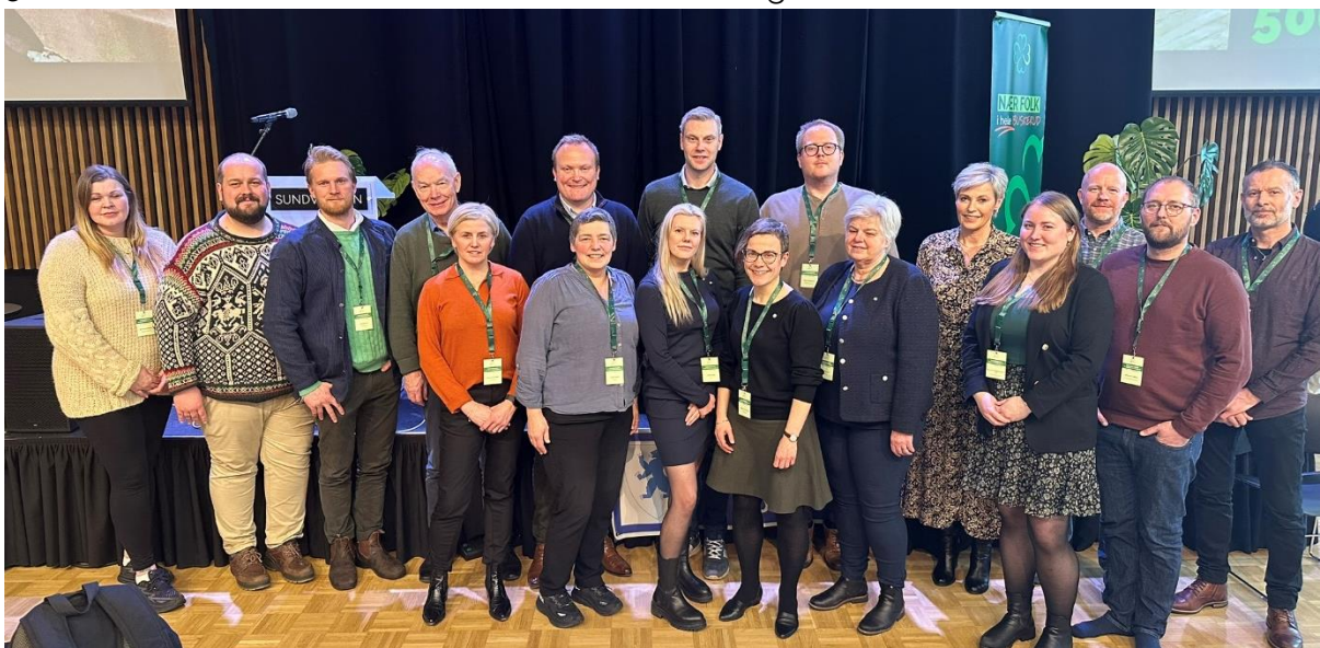
Figur 1 Nyvalgt fylkesstyre 2024