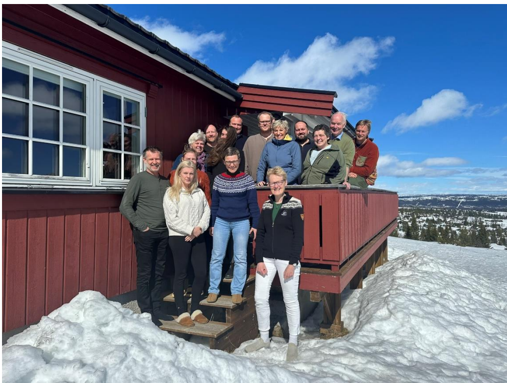
Figur 9 Mysende fylkesstyre og fylkestingrepresentanter på Røde Kors hytta på Golsfjellet

12. – 13. april var fylkestingsgruppa og fylkesstyret samlet til gruppeseminar på Røde Kors hytta på Golsfjellet. Målet med samlingen var teambuilding, strategiske diskusjoner inn i arbeidsåret og den kommende fylkestingsperioden og innføring i fylkeskommunens oppgaver.