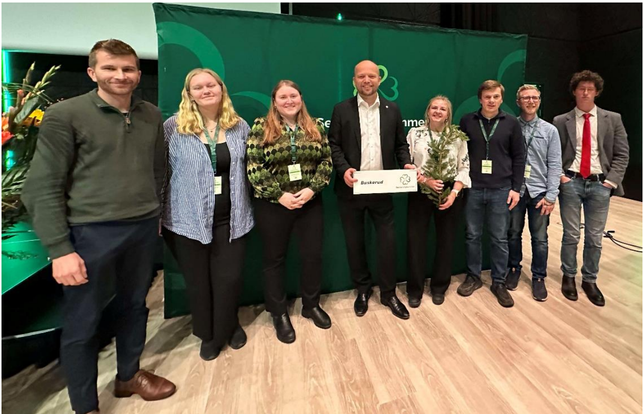
Buskerud Senterungdom med Trygve Slagsvold Vedum under Landsmøte 10.11.24