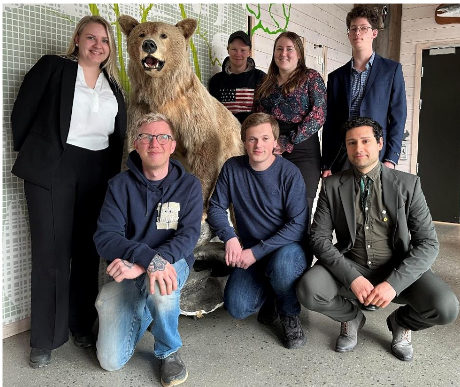
Fylkesårsmøte i Flå 2024