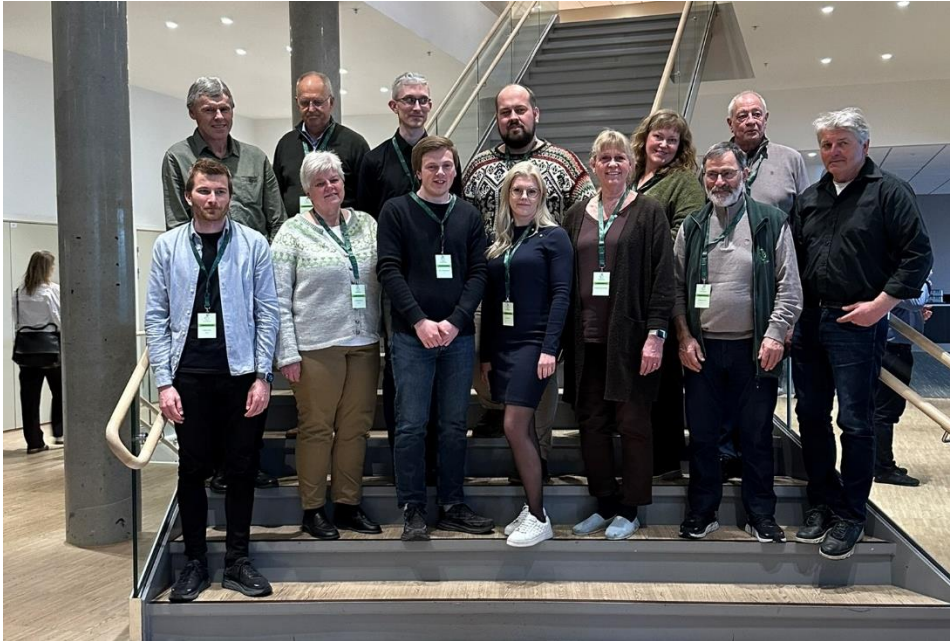
Figur 7 Lokallagsledere på konferanse i Bergen

Hele 13 av 18 lokallagsledere deltok på konferanse i Bergen i begynnelsen av april. En inspirerende og motiverende samling for alle som deltok.