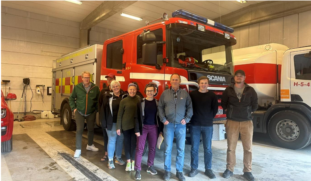
Figur 4 Fra besøk på brannstasjonen på Flå

Politiske saker som fylkesstyret har diskutert er: