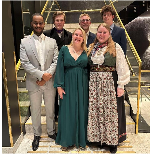
Klar for festmiddag på det 75. Landsmøte for Senterungdommen