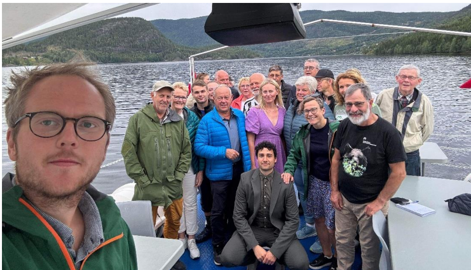
Figur 8 på Krøderfjorden

Som en markering, og oppstart av arbeidsåret etter sommeren inviterte BSp medlemmene på rekecruise på Krøderfjorden. Stortingsrepresentant Kjerstin Wøien Funderud fra Østfold var med og snakket litt om kommende statsbudsjett og ellers orienterte om hva som rører seg på stortinget. Cirka 25 medlemmer deltok.