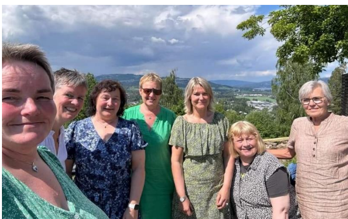
Senterkvinner fra Hedmark og Oppland samlet til Kvinner Kan på Honne. Bra gjeng, veldig interessante temaer - og vi har plass til flere. 🍀