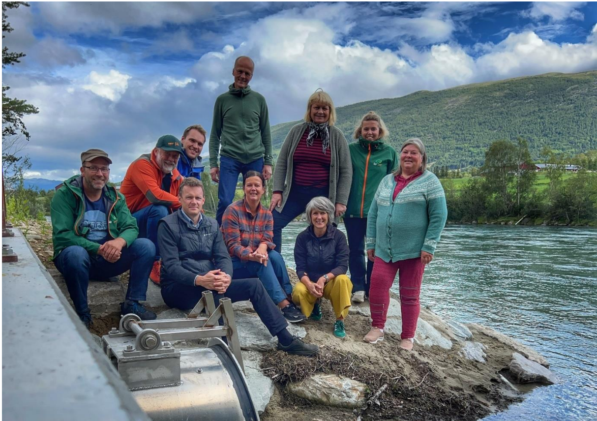
Samling for fylkestingsgruppa i Skjåk august 2024.