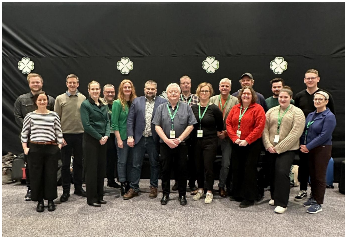
Delegasjonen vår med aktuelle «Glopparar» på fylkesårsmøte 2024

Gloppen Senterparti registrerer gruppemøta til kommunestyregruppa, det grønne hjulet og nytt stortingsvalprogram som studiearbeid knytt til ulike studieringsopplegg i regi av Senterpartiets studieforbund. Studieleiar er ansvarleg for å levere inn timar på dette.