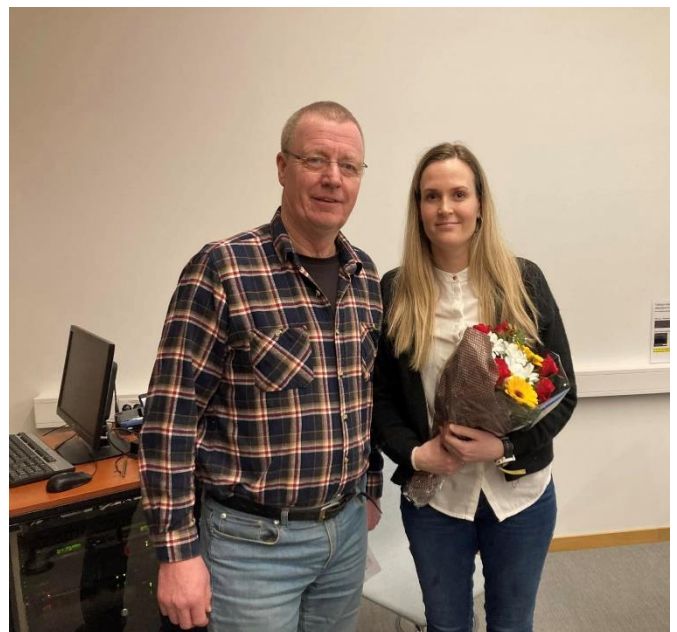
Nestleiar og leiar ved årsmøte 2024, eit godt team 😊