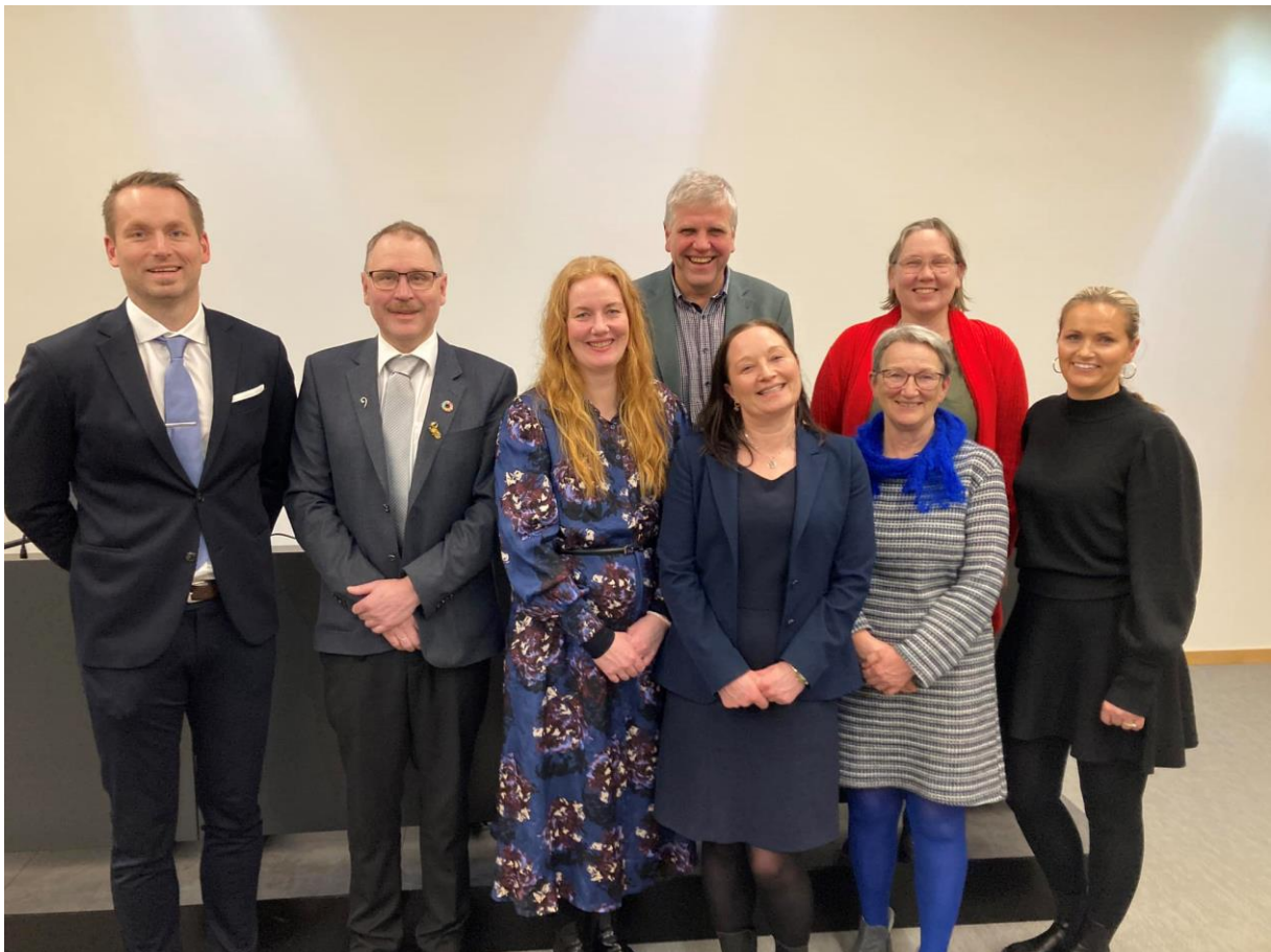
Kommunestyregruppa; Ein blid gjeng !