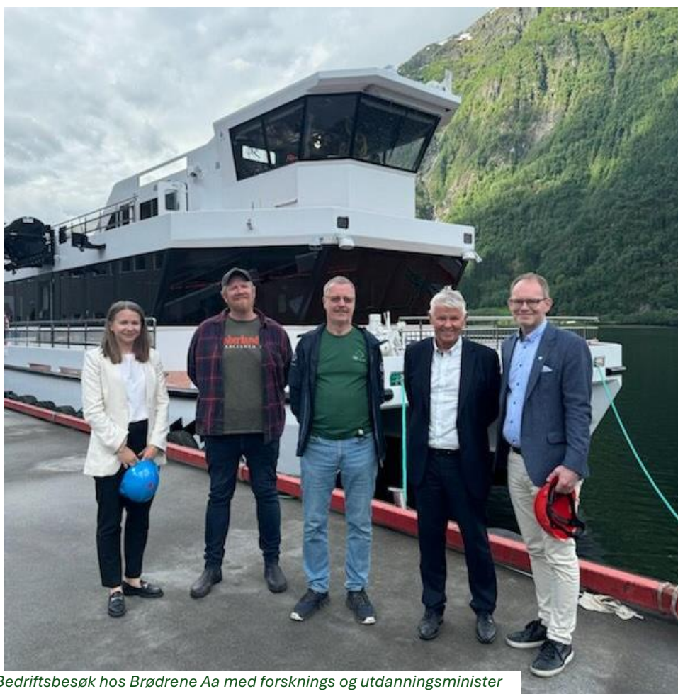
Bedriftsbesøk hos Brødrene Aa med forsknings og utdanningsminister Oddmund Hoel

Kommunal og moderniseringsminister er gjesten vår og held innleiing. Vi får nok høyre blant anna litt om «ekte» distriktpolitikk!