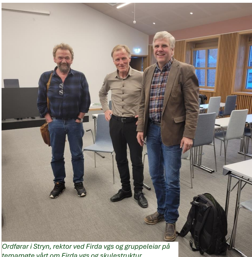
Ordfører i Stryn, rektor ved Firda vgs og gruppeleiar på temamøte vårt om Firda vgs og skulestruktur.