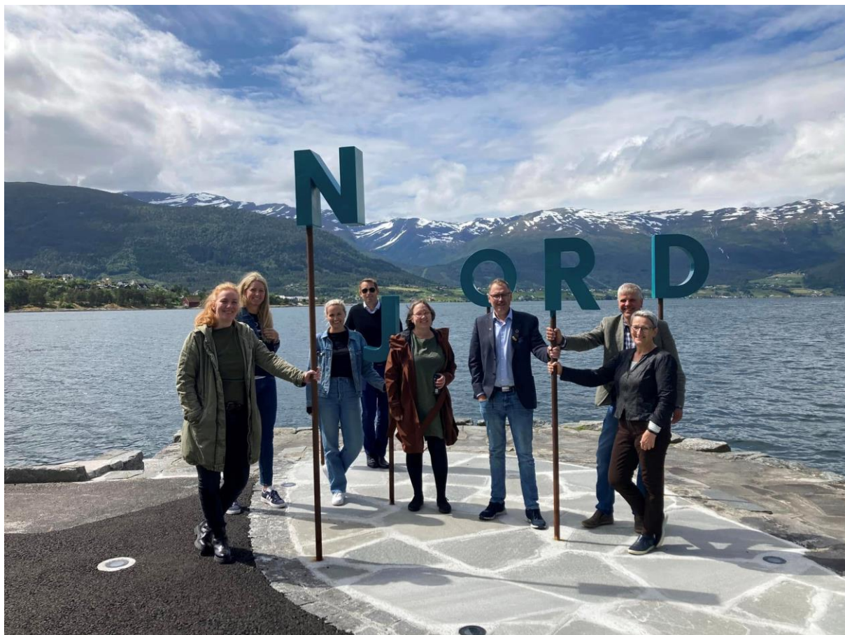
Kommunestyregruppa ein sommardag.